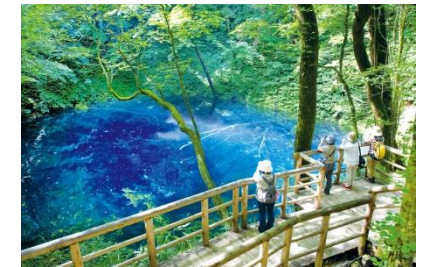
白神山地の玄関口 十二湖「青池」