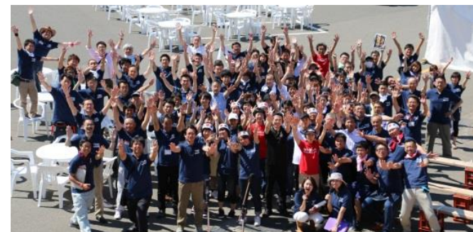
深浦マグロ料理グランプリ2015 (写真は全員ボランティアスタッフ)

深浦マグロステーキ丼の開発・提供を担う町内事業者による協議会を町として支援するため、2014年度からスタートしたグルメイベント「深浦マグロ料理料理グランプリ」開催費や広告宣伝費を中心に活動費を補助しています。