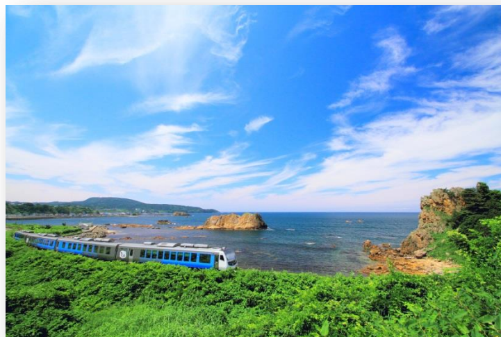
全国有数の「乗ってみたいローカル線」JR五能線リゾートしらかみ号 (写真は深浦駅～広戸駅間)