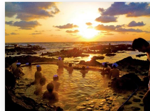
全国屈指の人気を誇る黄金崎不老ふ死温泉