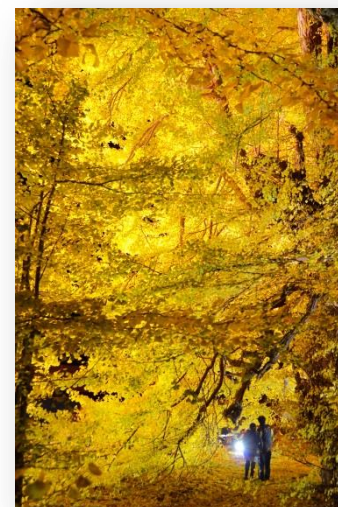
日本一の大イチヨウ ビッグイエロー