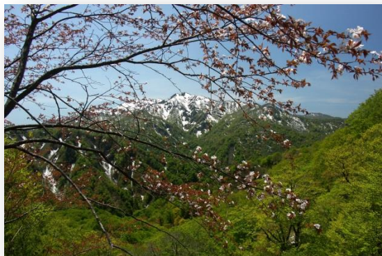
春の「世界自然遺産 白神山地」