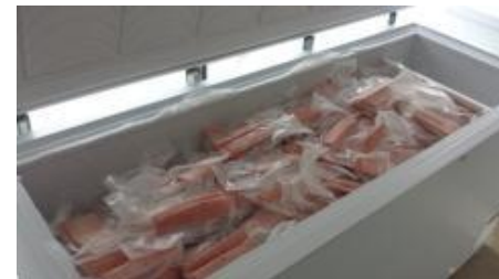
町長と議会の支援の象徴と言いきべき冷凍ストッカーが5台

マイナス60℃の本マグロ保存用冷凍ストッカーを町で5台購入・保有し、深浦マグロステーキ丼の提供のために用いる事業者に対し無償貸与しています。