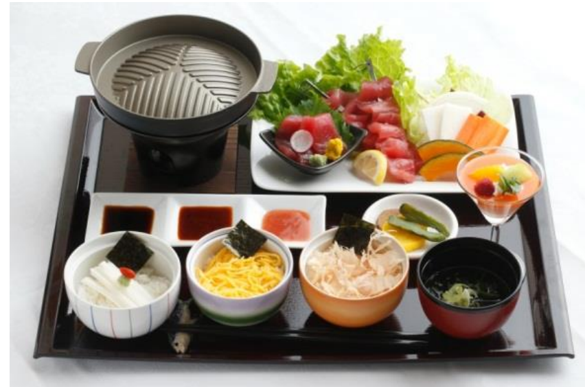
デビューから2年4か月で販売累計10万食を突破

2013年6月14日にデビュー以降、わずか2年4か月（2015年10月26日現在）で累計販売10万食を達成した青森県初の新・OMOTENASHIご当地グルメ。10万食の経済波及効果は5.6億円（じゃらんリサーチセンター試算）。深浦町産の天然本マグロ「深浦マグロ」を三個の小どんぶりで楽しむ、天然本マグロの産地ならではのマグロ尽くしどんぶり御膳。地場産の食材に徹底的にこだわり、汁物には白神山地ブナの森から注ぐミネラル豊富な海で育った天然わかめを使用した麺「つるつるわかめ」を用いる他、ステーキソースやデザート等に「ふかうら雪人参」を用いるなど、白神山地や日本海の豊かな自然等「地域の恵み」をギュッと凝縮しています。現地でしか食べるできない、深浦町を代表する新・ご当地グルメ。