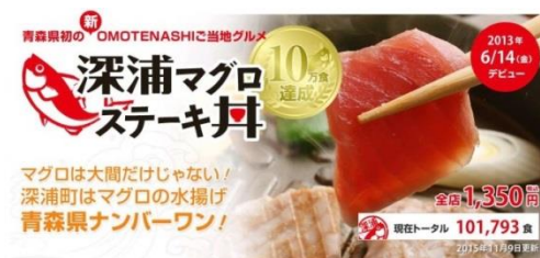
公式ウェブサイト