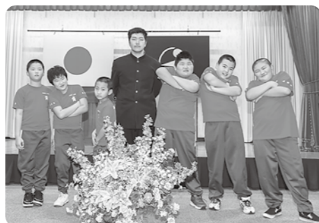
▲町のスポーツ賞も受賞しました