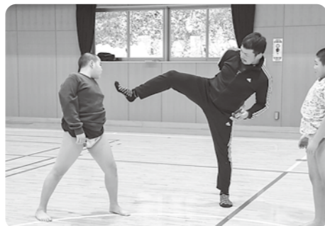
▲個別に指導する七戸監督