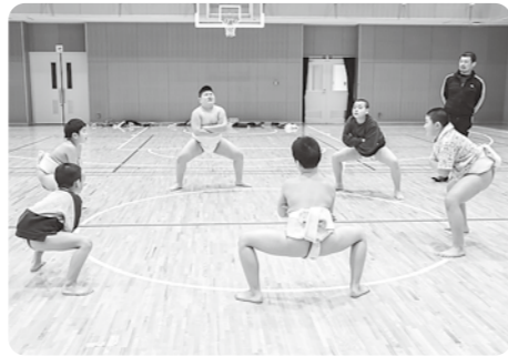
▲冬の基礎練習に励む子供たち