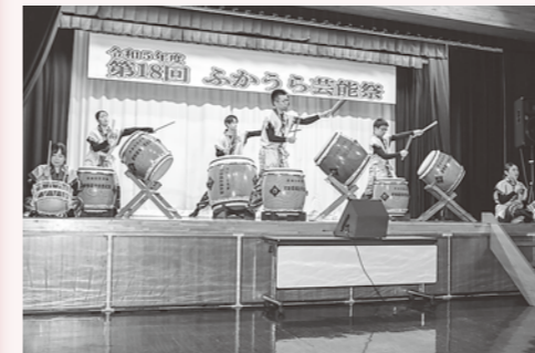
津軽深浦北前太鼓