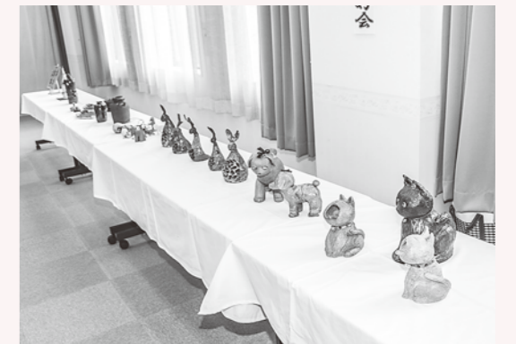
大戸瀬分館：展示作品