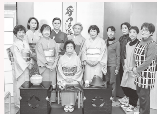
岩崎分館：お茶会の方々

11月4日と5日の二日間、深浦町公民館、岩崎ふれあい創造館、町農村環境改善センター（北金ヶ沢会館）の3か所同時に文化祭作品展が開催されました。書道や陶芸、絵画など、サークル活動で制作した作品のほか、保育園児や小学生によるかわいらしい作品、町民が撮影した写真などが各会場に展示されました。 また今年も数年前に深浦町公民館と岩崎分館で食堂部門も開設されました。陶芸体験やおもち作り体験、お茶会、フリーマーケット、よさこい演舞などのイベントも開催され、来場者を楽しませていました。