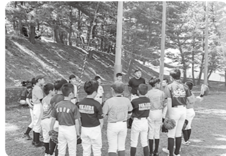
▲練習中にミーティングをする選手と監督

1週間の練習は平日に3回で、そのうち2日は深浦町と鯉ヶ沢町に分かれて練習しています。週末は土曜日に練習をしており、日曜日に試合をすることが多いです。