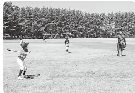
▲親や体協野球部も練習に協力しています