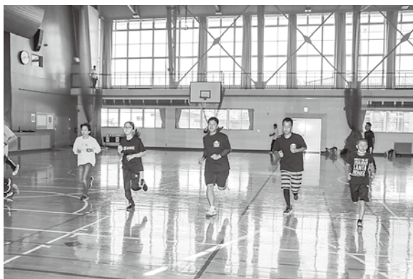
体力測定最後の種目 20mシャトルラン