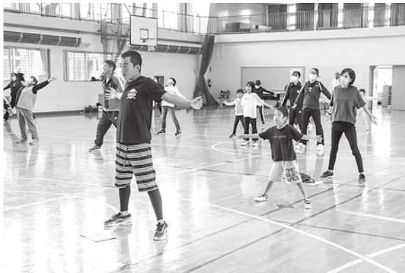
参加者全員で準備体操

スポーツの日にあわせて深浦町民体育館で軽スポーツフェスティバルが開催されました。会場には子どもからお年寄りまで幅広い世代の町民が30人以上集まり、体力・運動能力調査や軽スポーツを楽しみました。 この日は2人1組になり、シャフルボードとモルックという軽スポーツを行いました。参加者は真剣な表情でペアの仲間と相談しながら、勝利を目指していました。中には親子のチームもあり、和気あいあいと楽しんでいました。2つの種目で優秀な成績を収めたペアにはヨガマットなどの景品が贈られました。