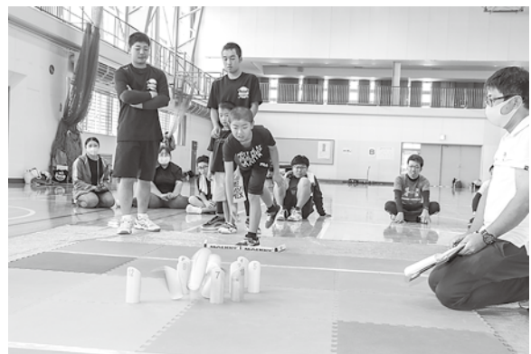
モルックを楽しむ参加者たち