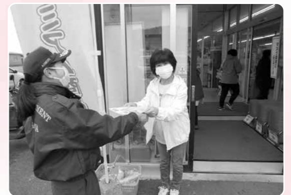
買い物に来た方にパンフレットとマスクを配布しました(10月23日)