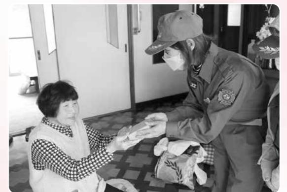
女性消防団員から火災警報器が手渡される(10月18日)