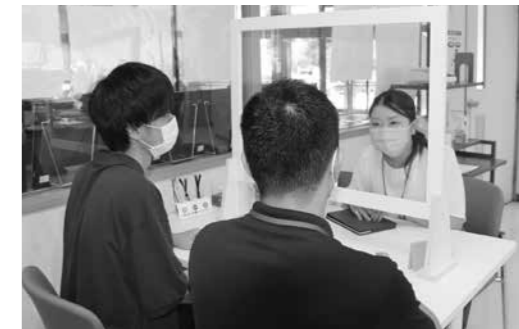
▲申請手続きの説明を行う役場職員