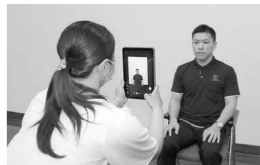
▲顔写真の撮影もサポートいたします!

注) ※マイナポイントはキャッシュレス決済サービス(現金以外で買い物をしているカードやスマホ決済)に対して付与されるものです(例:WAON、CoGCa、PayPay等)。マイナンバーカードに直接ポイントが付与されるものではありません。