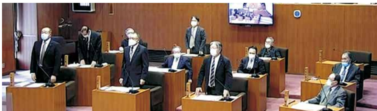
▲採決は賛成少数（賛成5名、反対6名）で否決

6月定例会に続く議員定数を12人から11人に削減する議員発議の条例改正案を今回は討論なしの賛成5名、反対6名の賛成少数で否決となった。