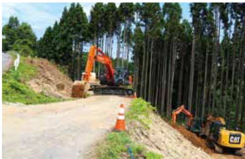
▲広域農道との接続部分を改良