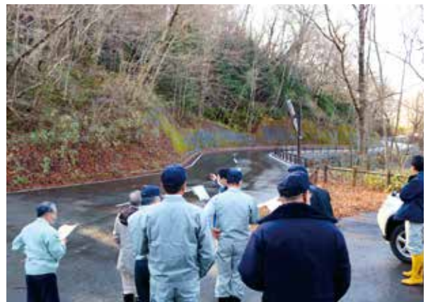
▲ 町道十二湖公園線(松神地区)

カーブが多く大型観光バスが通ると対向車とすれ違えない状況だった狭い区間を平成30年度から令和2年度にかけて、総事業費1億9557万9千円、総施工延長589・5メートルを拡幅整備した状況などについて、町担当者から説明を受けた。