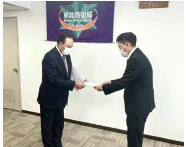
▲市川局長(右)に要請書を提出した小野議長(左)