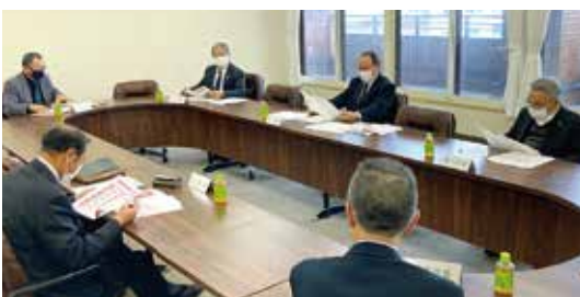
▲議会広報編集委員会(1月26日)