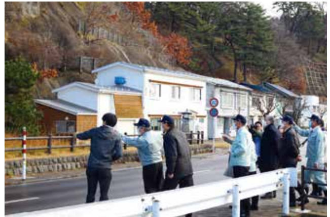
▲ 1個目の燃料タンクが発見された現場付近(猿神鼻岩洞門)