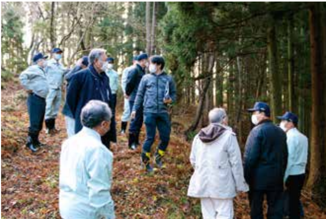
▲ 2個目の燃料タンクが発見された山林入口付近(深浦大館)

10月30日午後6時頃に投棄された米軍三沢基地所属F16戦闘機の燃料タンクが発見された2か所の現場付近で町担当者から説明を受けた。