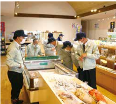
▲ 物産館「コロポックル」

ウエスバ椿山駅近くの物産館「コロポックル」が改修され、7月に(一社)深浦町観光協会の事務所が移転した。