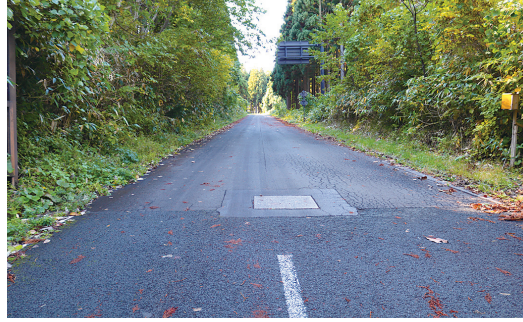
▲林道を廃止し、町道に認定

町道の路線認定の件 町道及び林道を変更・廃止し、町道十二湖公園線を新たに認定する。