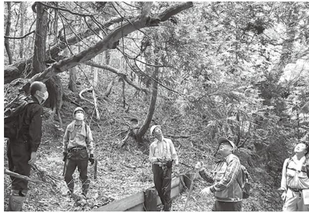
遊歩道に危険があるかどうか調査している様子

町観光課は「今後も関係機関と連携し、安全に散策を楽しめる十二湖公園にしていきたい」と話していました。