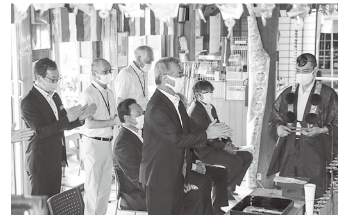
安全を祈願しました

今年も岡崎海岸は、水質調査の結果が最も良いA/A判定となっており、大人も子どもも楽しめるスポットとなっています。