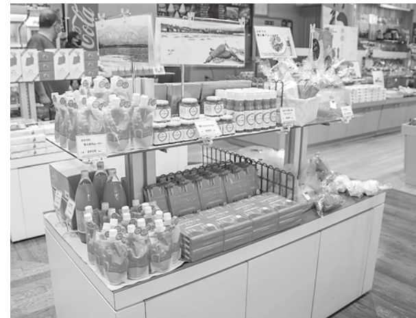
「ふかうら雪人参」一色のコーナーもあります

また、軽食コーナーもあります。深浦牛を使用したメンチカツや、青池のような色をした「青池ティー」など深浦にちなんだ商品も盛りだくさんです。皆さん、ふらっと立ち寄って涼んでいきませんか。