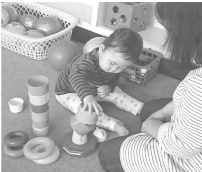
提供会員とブロック遊びに夢中 五所川原市働く婦人の家・託児室 での様子