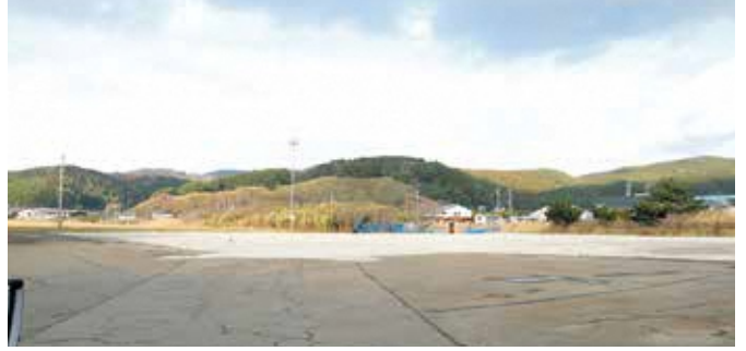
▲岩崎スポーツセンター解体後