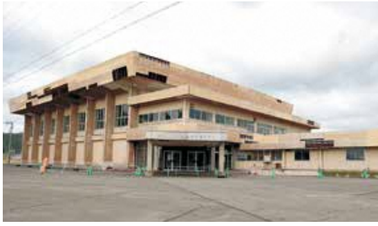
▲岩崎スポーツセンター解体前