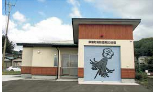
▲新築した消防屯所(岩崎中・上地区)