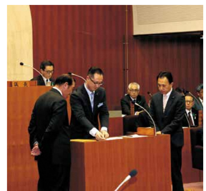
▲議長・副議長選挙投票の様子