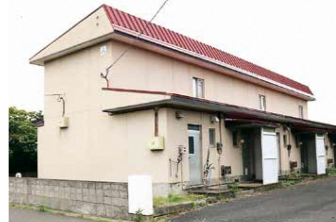
▲リフォーム調査する旧教員住宅(岡町地区)

補正予算議案 (全員賛成) 可決 ◆平成30年度深浦町一般会計補正予算(第1号) ●歳入の主なもの ●地方交付税 1,000万円 ●県支出金 1,200万円 ●農林水産業費補助金(深浦地区水産物供給基盤機能保全事業補助金) 713万円 ●町債 6940万円 ●土木債(町道十二湖公園線道路改良事業債) 1200万円 ●歳入歳出をそれぞれ3750万1千円増額し、歳入歳出予算の総額を73億7750万1千円とした。 ●歳入の主なもの ●衛生費 221万円 ●国保事業特別会計直診勘定繰入金 597万円 ●農林水産業費 40万円 ●海水処理施設機能強化事業費(新深浦町漁協(北金ヶ沢漁港)の海水処理施設の殺菌配水施設の改修) 1702万円 ●土木費 40万円 ●定住促進住宅整備事業費(旧教員住宅リフォーム調査業務委託料)(深浦岡町地区) ●深浦町国民健康保険事業特別会計(直診勘定)補正予算(全員賛成)可決 ●歳入歳出をそれぞれ739万5千円増額し、歳入歳出予算の総額を2億4069万5千円とした。