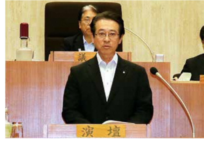
▲町長提案理由の説明

補正予算議案 (全員賛成) 可決 ◆平成30年度深浦町一般会計補正予算(第1号) ●歳入の主なもの ●地方交付税 1,000万円 ●県支出金 1,200万円 ●農林水産業費補助金(深浦地区水産物供給基盤機能保全事業補助金) 713万円 ●町債 6940万円 ●土木債(町道十二湖公園線道路改良事業債) 1200万円 ●歳入歳出をそれぞれ3750万1千円増額し、歳入歳出予算の総額を73億7750万1千円とした。 ●歳入の主なもの ●衛生費 221万円 ●国保事業特別会計直診勘定繰入金 597万円 ●農林水産業費 40万円 ●海水処理施設機能強化事業費(新深浦町漁協(北金ヶ沢漁港)の海水処理施設の殺菌配水施設の改修) 1702万円 ●土木費 40万円 ●定住促進住宅整備事業費(旧教員住宅リフォーム調査業務委託料)(深浦岡町地区) ●深浦町国民健康保険事業特別会計(直診勘定)補正予算(全員賛成)可決 ●歳入歳出をそれぞれ739万5千円増額し、歳入歳出予算の総額を2億4069万5千円とした。