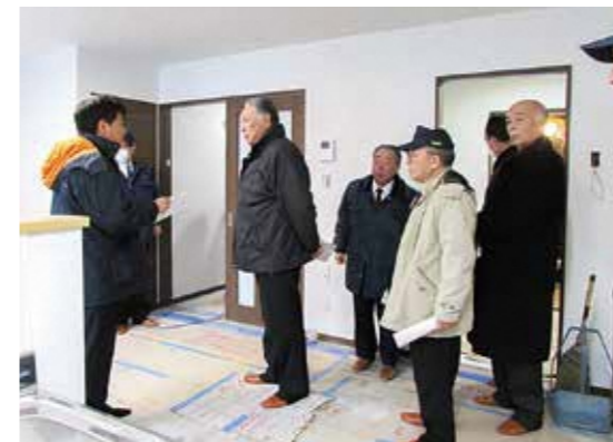
▲定住促進住宅(岡町)A棟

▼深浦地区に整備された定住促進住宅は1戸建てが3棟である。3棟とも2階建て延床面積89.42平方メートルである。