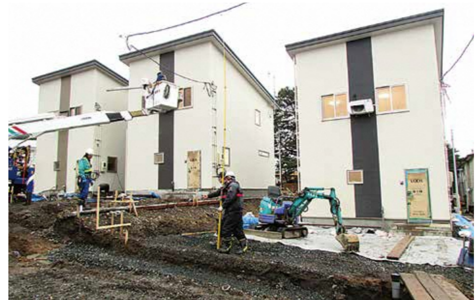
▶急ピッチで整備が進む外構工事