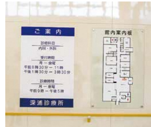
▲入口に掲示された案内表示

▼6月1日に開業する新深浦診療所は、延床面積713.07平方メートルで待合室は開放的な空間でも明るく、CT検査、エコー検査などの機器も導入され、今後は、開業に向けて備品等の設置作業が行われる。