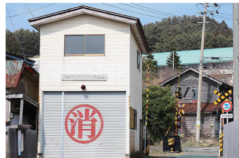
▲整備予定の消防屯所(岩崎中地区)