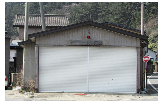
▲整備予定の消防屯所(岩崎上地区)