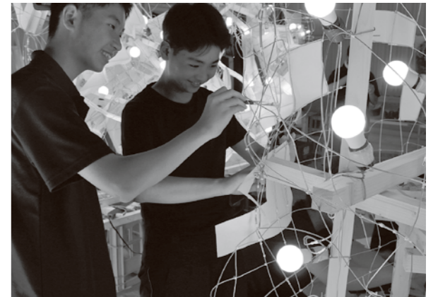
紙貼りをしている生徒たち