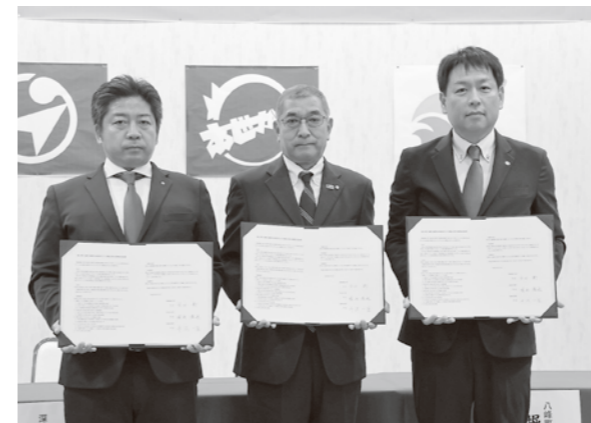
協定書を掲げる(左から)平沢町長、平田町長(鱒ヶ沢町)、堀内町長(八峰町)