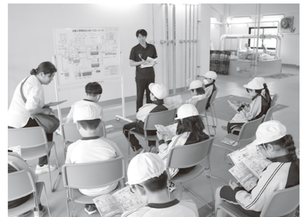
浄化センターの説明を受ける児童たち