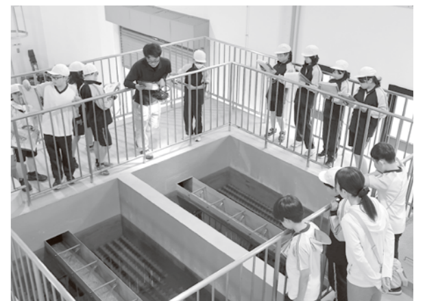
浄水場の説明を受ける児童たち