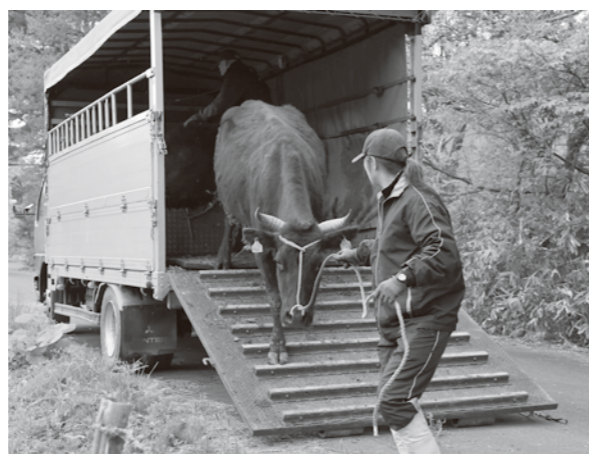
待ちわびた牧場へ向かう牛