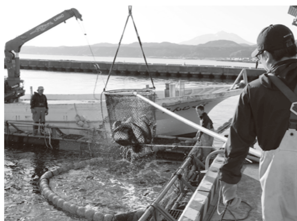
水揚げされる青森サーモン

深浦漁協及び新深浦町漁協と連携しながら、深浦港では約70t、北金ヶ沢漁港で約220t、合計約290tが水揚げされる予定です。水揚げ後は全国各地に出荷され、皆さんに深浦産サーモンを味わっていただきます。