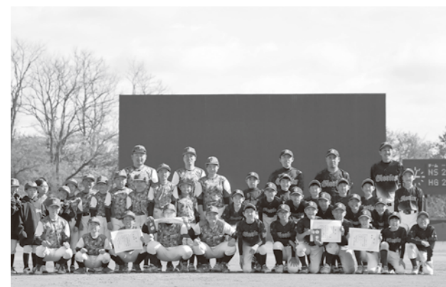
記念撮影をする両チーム (西津軽スピリッツ：左側、八峰グローリーズ：右側)