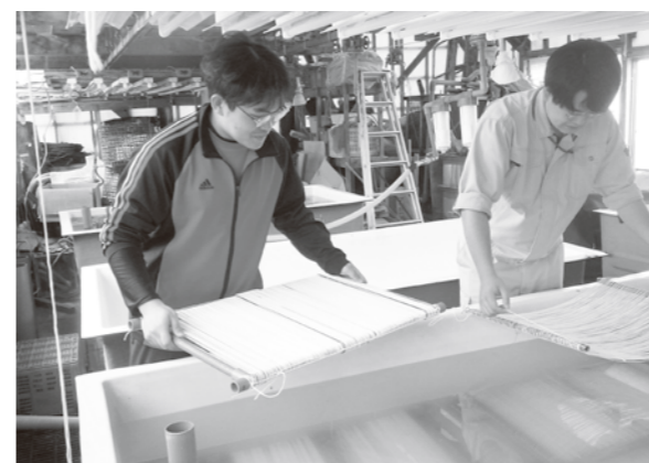
採苗作業をする漁協職員と町職員