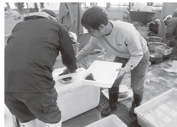
ナマコを計量する漁師