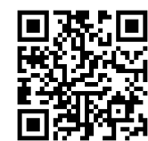
▲申込フォーム はこちら