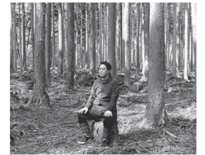
100年後のスギ林をイメージ