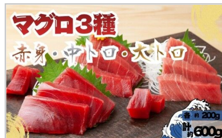
【7月上旬から順次発送】本マグロ3種赤 身中トロ大トロ各1柵