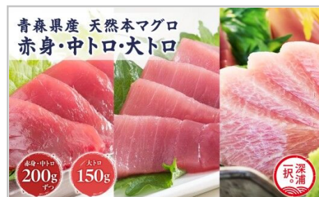
天然本マグロ赤身中トロ大トロ3種セッ ト