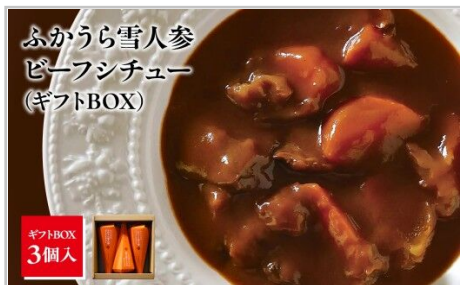
ふかうら雪人参 ビーフシチュー (ギフトBOX)