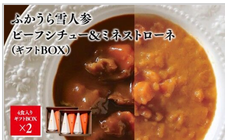
ふかうら雪人参 ビーフシチュー&ミネストローネ (ギフトBOX)