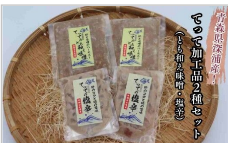
【青森県深浦町産】てって（ウマツラハギ）加工品2種詰合せセット（と…