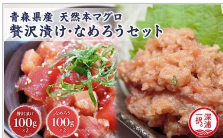
天然本マグロ漬けなめろう2種セット