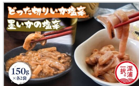
大船海産どった切りいか塩辛と墨いかの塩辛セット