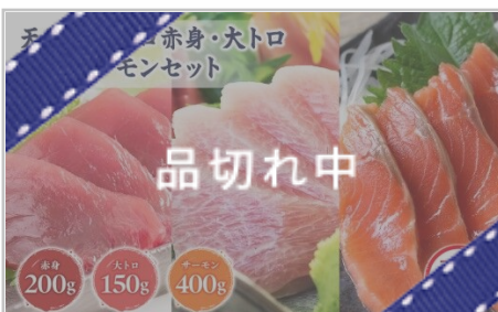
青森サーモン&天然本マグロ赤身大トロ セット計750g