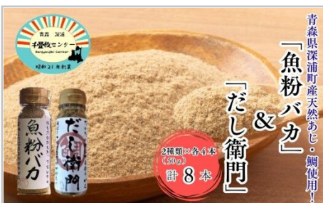
「魚粉バカ」 & 「だし衛門」