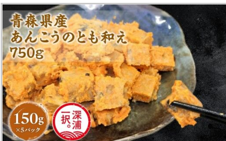
大船海産あんこうのとも和え150g5袋