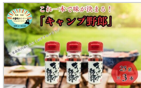
これ一本で味が決まる！ 「キャンプ野郎」