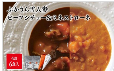
ふかうら雪人参 ビーフシチュー&ミネストローネ