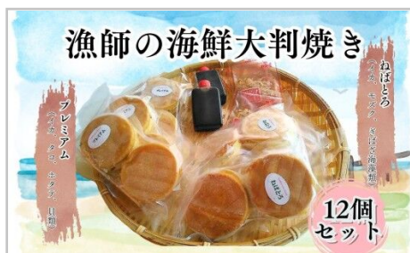
漁師の海鮮大判焼き12個セット