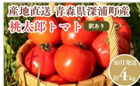
【10月発送】 訳あり青森県産桃太郎トマト約4kg大玉tomato新鮮野菜旬甘い…