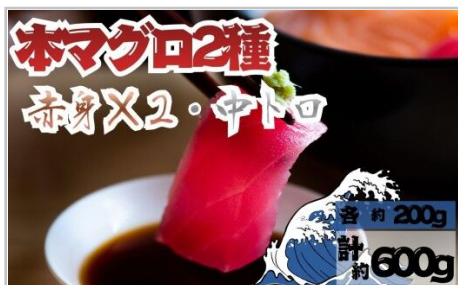
【7月上旬から順次発送】本マグロ赤身2 柵中トロ1柵セット