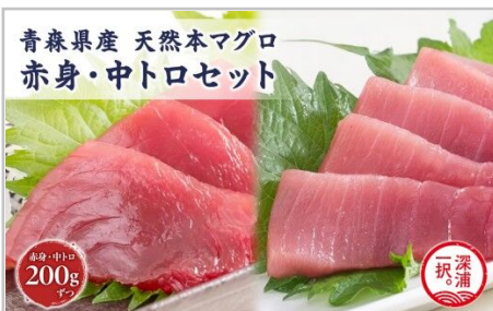
天然本マグロ赤身中トロ2種セット