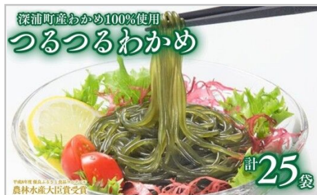
つるつるわかめ特盛セット