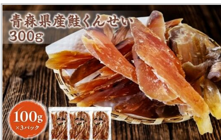
青森県産鮭くんせい 300g