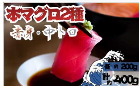
【7月上旬から順次発送】本マグロ赤身 中トロ各1柵セット