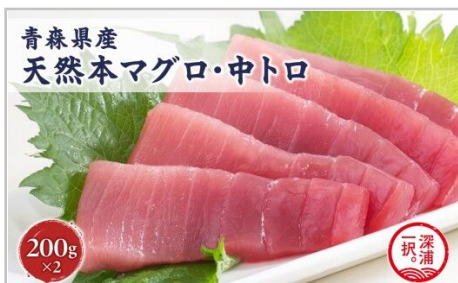
天然本マグロ中トロ計400g