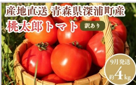
【9月発送】 訳あり青森県産桃太郎トマト約4kg大玉tomato新鮮野菜旬甘い…