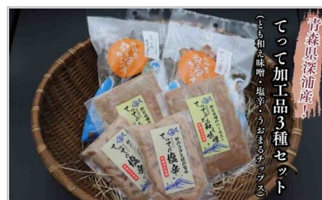
【青森県深浦町産】てって（ウマツラハギ）加工品3種詰合せセット（と…