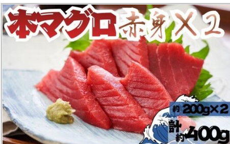
本マグロ赤身2柵国産本鮭