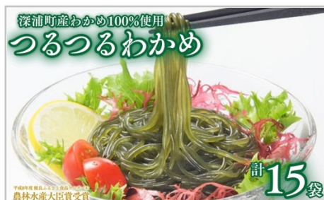
深浦町産わかめ100%使用 つるつるわかめ