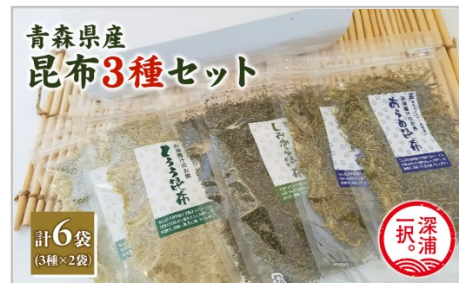
青森県産 昆布3種セット