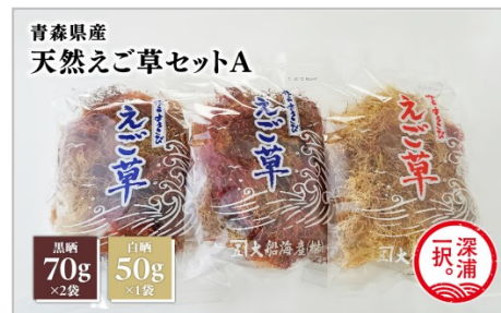
青森県産 天然えご草セットA