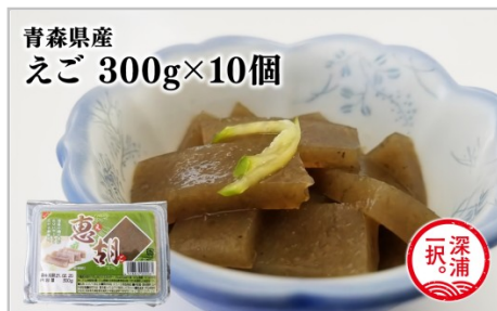
青森県産 えご 300g×10個