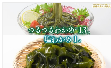
つるつるわかめ計13袋 塩わかめ1袋