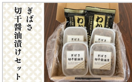
ぎばさ 切干醤油漬 セット