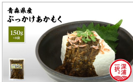
青森県産 ぶっかけあかもく