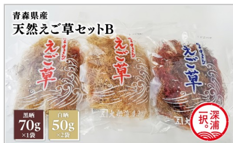
青森県産 天然えご草セットB