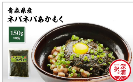
青森県産 ネバネバあかもく