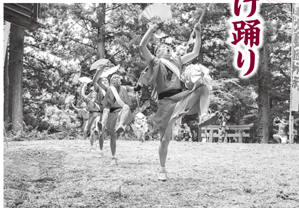
花上げ踊りを奉納する男衆