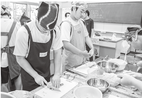
イカを捌く生徒たち

完成した料理は、生徒や先生、協力した新深浦町漁協北金ヶ沢地区女性部の方々でおいしくいただきました。生徒からは、「3枚におろすのが難しかった」「自分たちで捌いたカワハギとアジのフライがおいしかった」などの声が上ががり、深浦の魚のおいしさを知るとともに、地域食材を通じて料理の楽しさも感じていたようでした。