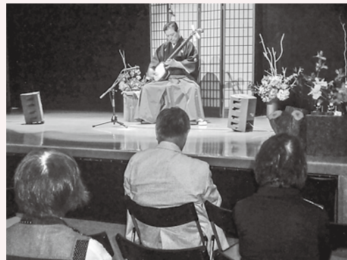
迫力ある津軽三味線に拍手喝采