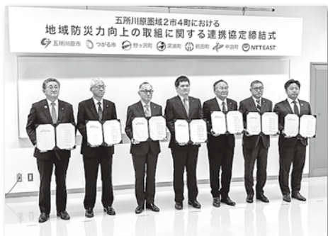
地域防災力向上の取組に関する連携協定を結んだ五所川原圏域2市4町とNTT 東日本株式会社青森支店