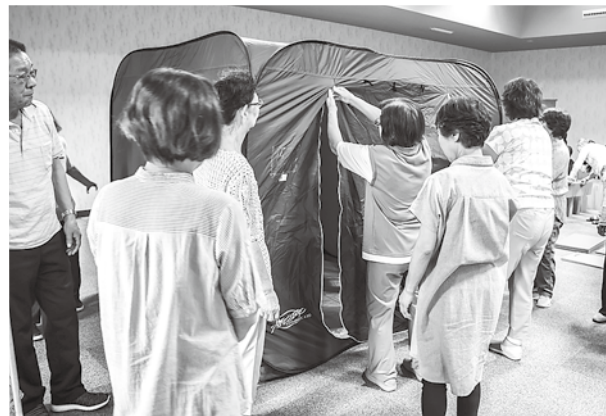
避難時用のポップアップテントの設置を体験する参加者たち

昼食では、研修会で自分たちが準備した炊飯袋（ハイゼックス）で炊いたお米と岩崎地区奉仕団によるカレーの炊き出しを行い、有事の際の対応を確認しました。