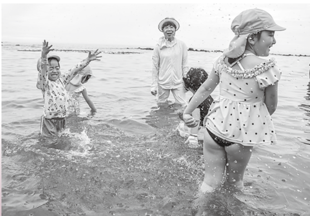
海水浴を楽しむ園児たち

町内には会場となった岡崎海岸のほか、千畳敷海岸や森山海岸など、日本海の素晴らしい景観を楽しめる海岸が多く点在していることから、多くの海水浴客の訪れを期待したいところです。