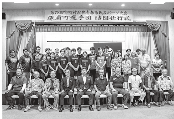
出場する選手の皆さん