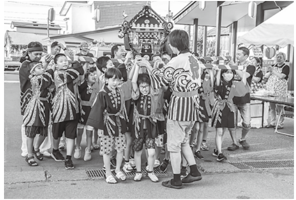
お神輿を担ぐ子どもたち