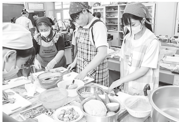
三枚おろしのやり方を教えてもらう生徒たち