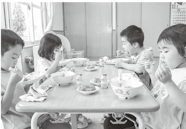
給食を食べる認定こども園および保育園の園児たち