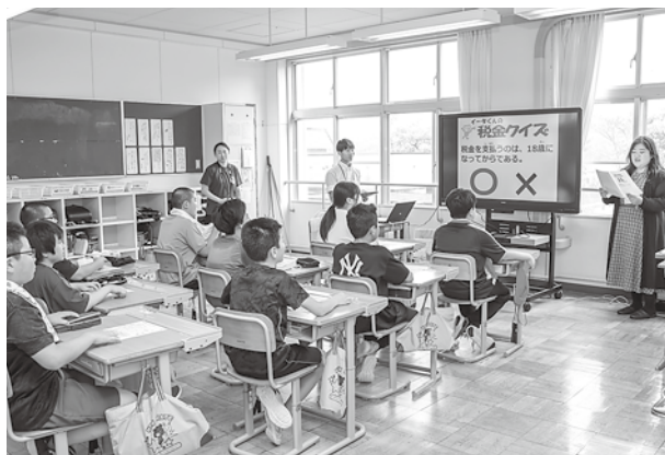
〇×クイズの回答を考える児童たち