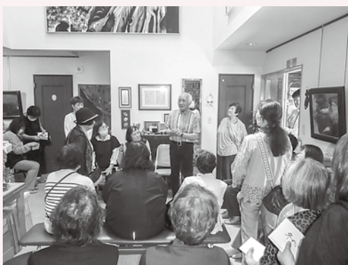
絵画と深浦町での思い出話で大盛り上がり