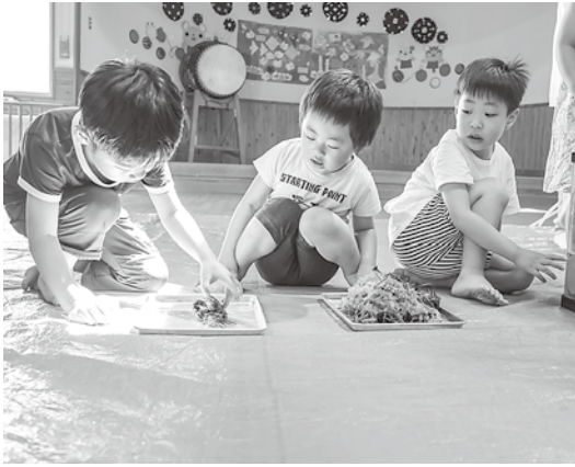
海の生き物とふれあう子どもたち