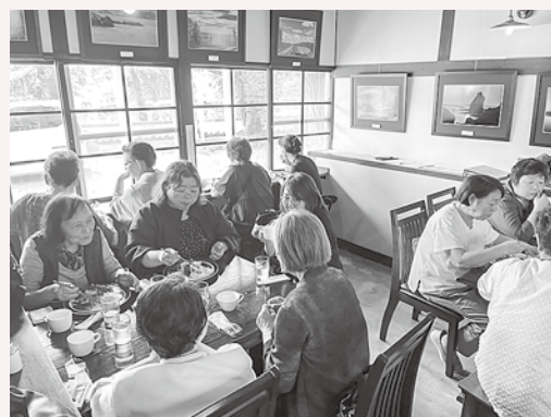
駅舎を活用した喫茶店で昼食