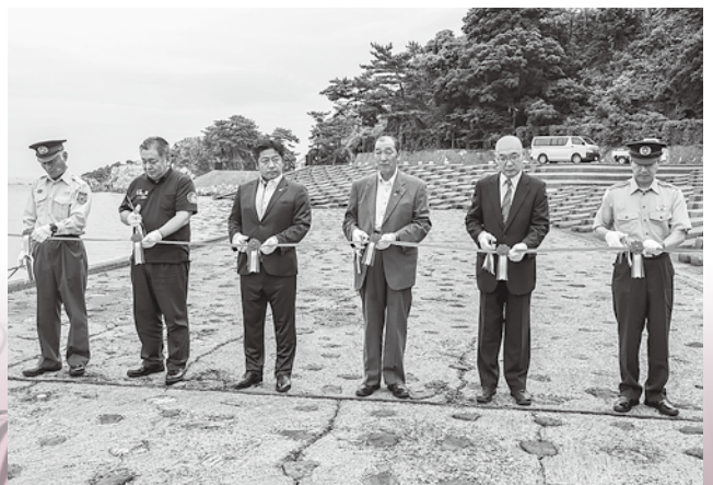
関係者によるテープカットセレモニー