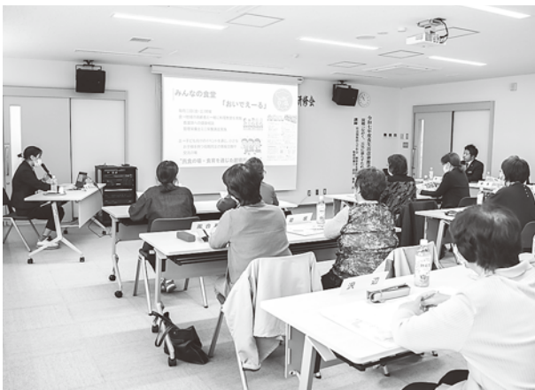
総会後に行われた研修会の様子