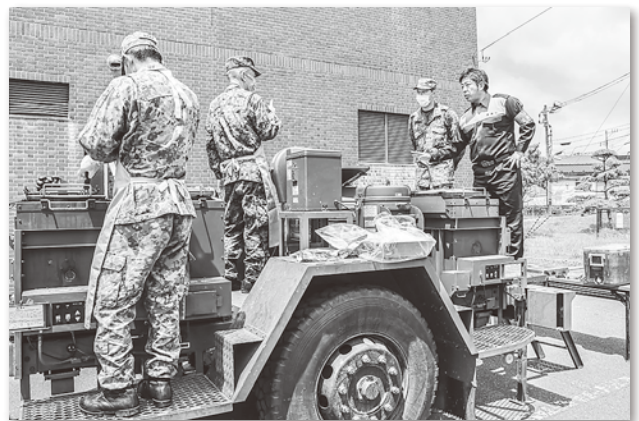
自衛隊による炊き出しの様子