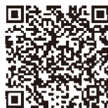
(スマートフォン版)