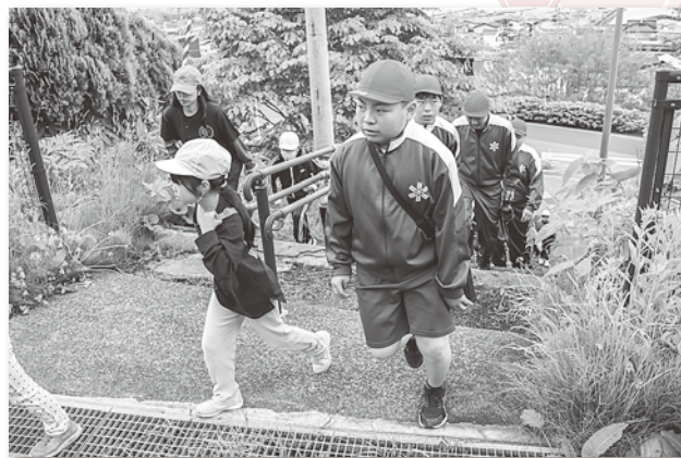
全校で避難する修道小学校の児童たち