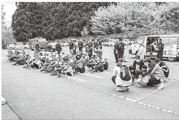
北金ヶ沢総合防災センターへ避難した児童たちと町民

町では、令和5年2月に防災ハザードマップを新たに作成・配布しました。ハザードマップでは、津波による浸水区域や大雨による土砂災害警戒区域、各地域の避難所などが掲載されています。災害に備えて住居周辺の避難所などの確認を心がけましょう。町では今後とも、有事の際の備えとなるよう計画的な防災基盤の強化を図ることにしています。