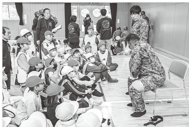
止血の方法を学ぶ児童たち