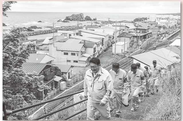
高台に避難する役場職員