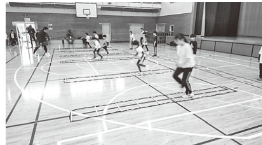
陸上競技練習会「走り方教室」