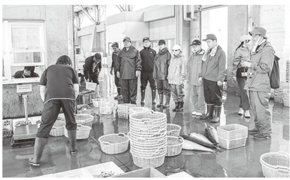
荷さばき所を見学する生徒