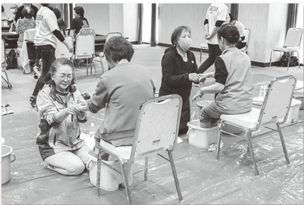
足湯ボランティアを体験する日赤奉仕団員