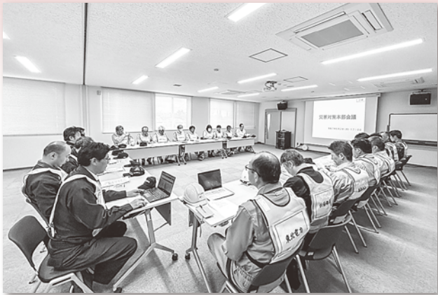
災害対策本部設置運営訓練