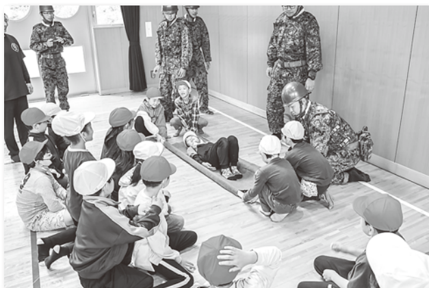
簡易担架を持ち上げる児童たち