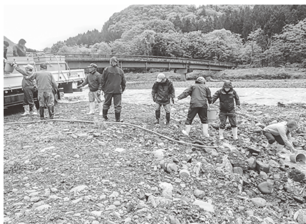
追良瀬川にアユを放流する様子

今年の放流は5月23日から始まり、アユは鱒ヶ沢町役場で体長約12cm、体重約8gに、ヤマメは追良瀬内水面漁協で体長約6cm、体重約4gになるまでそれぞれ飼育したものを各河川に運び放流しました。