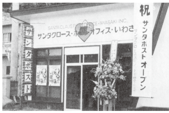
写真1 1989（平成元）年7月にオープンしたサンタポスト＝1989（平成元）年7月撮影。