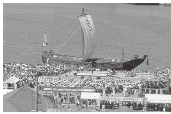
写真2 深浦港に入港した北前船「辰悦丸」＝1986（昭和61）年6月撮影・東北印刷（株）提供